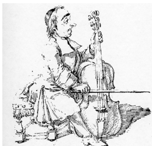
Pier Leone Ghezzi, Il virtuoso del Sig.r de Bacqueville vers 1720

« L'acceptation de pratiques alternatives viables est une très bonne chose. Elle nous permet de garder les yeux ouverts sur la possibilité de produire de la musique d'une manière nouvelle, sous la régulation de nouveaux idéaux. Elle nous permet de garder les yeux ouverts sur la nature intrinsèquement critique et révisable de nos concepts. Plus important encore, elle nous aide à surmonter ce désir profondément enraciné de détenir la plus dangereuse des croyances, à savoir que nous avons toujours eu des pratiques absolument correctes ».