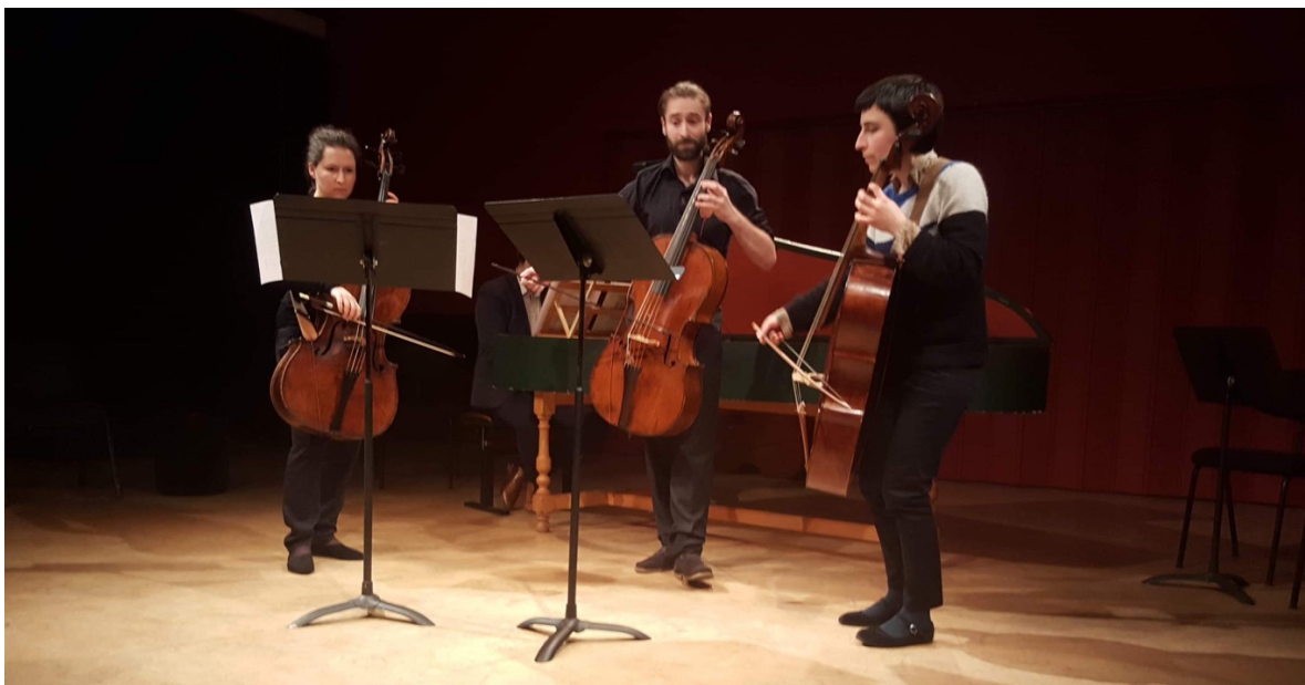
Concert de classe, 2019

Par leur parcours antérieur, leur travail et leur curiosité, certains étudiants développent des compétences propres qu'ils sont invités à partager avec leurs autres étudiants. Ces échanges créent une dynamique d'entraide et une grande cohésion du groupe. Dans les conservatoires napolitains du XVIIIe siècle, les « Mastricelli » étaient des étudiants avancés qui avaient une charge d'enseignement comme « petits maîtres » sous la responsabilité du maestro.