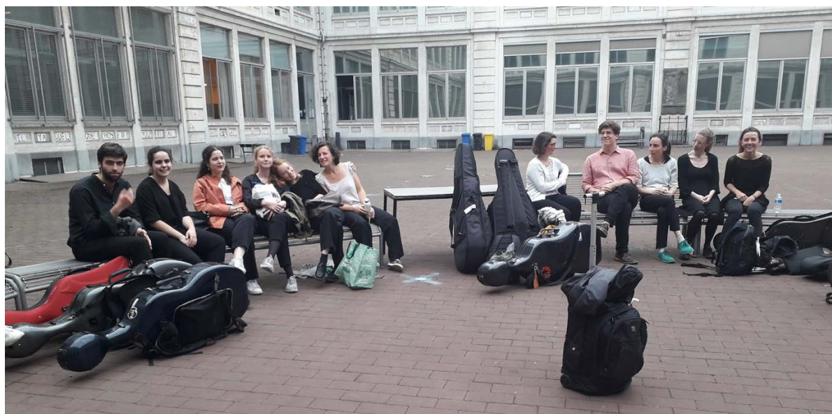
Après les évaluations de la classe... juin 2022

L'apprentissage du violoncelle baroque doit idéalement se faire avec une compréhension fine des pratiques des différents instruments en lien avec les époques, les lieux et les situations dans les fonctions de consort, de basse continue et de soliste. Que ce soit par l'usage des petits violoncelli à 4 cordes accordés sol-ré-la-mi, ou à 5 cordes accordés avec une chanterelle de ré ou de mi, sans oublier les basses de violon accordées en do ou en si bémol, à 4 ou 5 cordes... Ces multiples instruments peuvent être joués assis, tenus entre les jambes mais aussi debout, accrochés avec une sangle ou posés sur un tabouret ou simplement posés par terre. Quant à l'archet, le violoncelliste continuiste tiendra son archet le plus souvent tenu par le dessous, main dans la hausse, au moins jusqu'en 1730, alors que le soliste le tiendra par le dessus, à la manière des Napolitains, dès le début du XVIIIe.