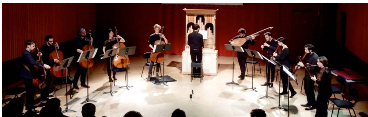
Projet 'Autour des basses' 2018

Organisé par la classe de violoncelle, ce projet a la particularité de mettre en valeur tous les instruments jouant les registres graves du département de musique ancienne. Il met en lien les classes d'orgue, clavecin, flûte à bec, luth et théorbe, gambe, violoncelle, violone et contrebasse, dans le but de présenter des répertoires spécifiques aux instruments graves issus des XVIe, XVIIe et XVIIIe siècles.